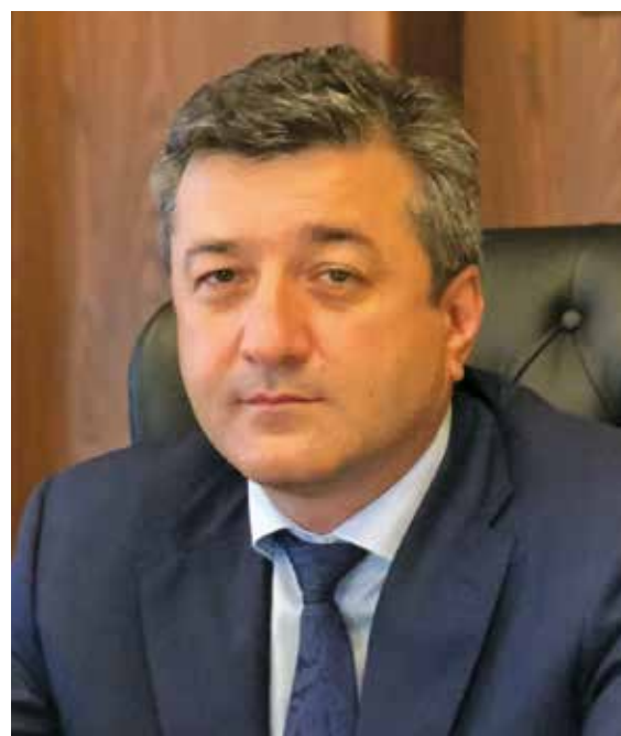
Таймураз Ахохов, глава местной администрации городского округа Нальчик

В рамках федеральных программ «Формирование комфортной городской среды» и «Безопасные и качественные автомобильные дороги» приведут в порядок целый ряд социальных и культурных