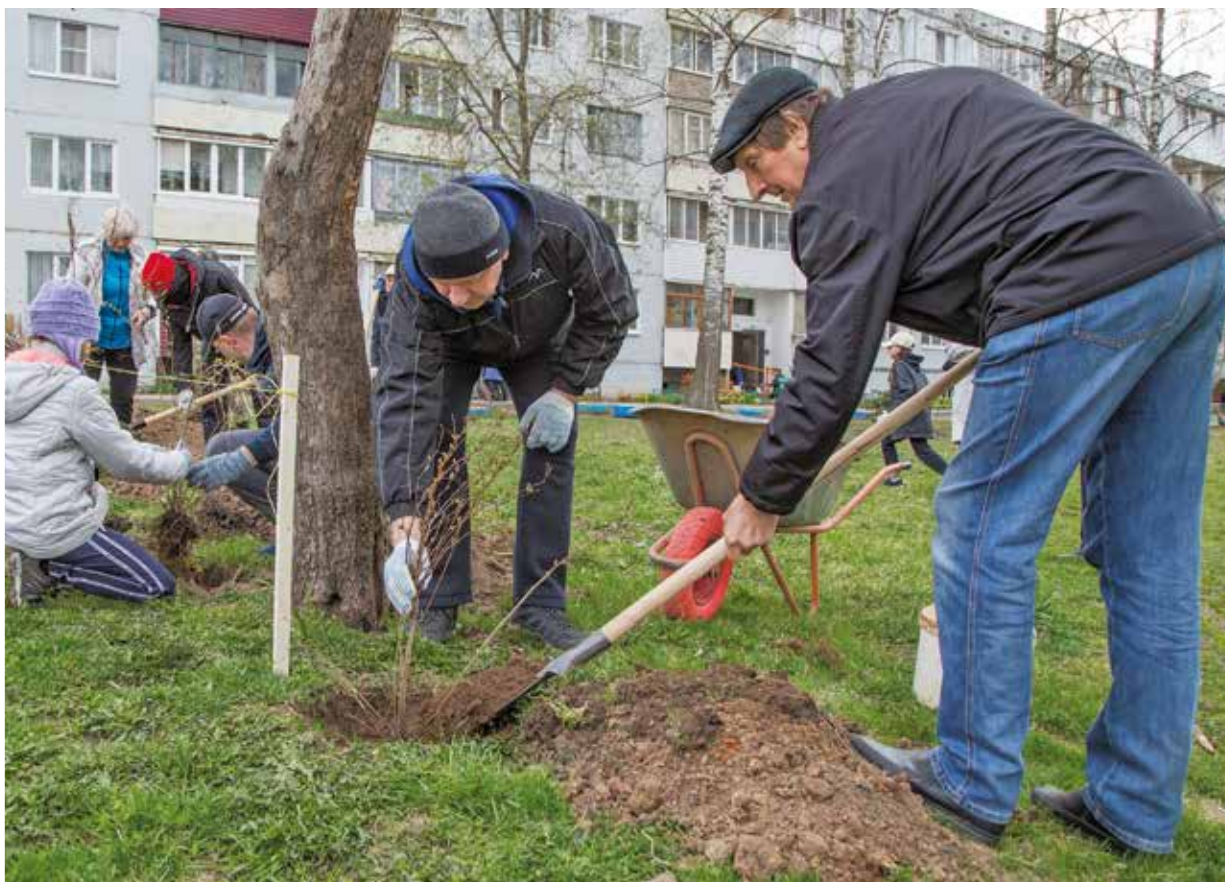
Глава города на субботнике

принимают участие артисты городских домов культуры. Сами горожане устраивают выставки урожая, собранного ими на приусадебных участках, проводят конкурс «Лучший пирог», организуют мастер-классы.