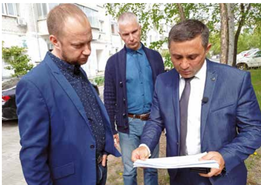
Олег Иمامев (справа), глава администрации города Благовещенска

Мэр Благовещенска Олег Иمامев рассказывает о реализации в городе программы «1000 дворов».