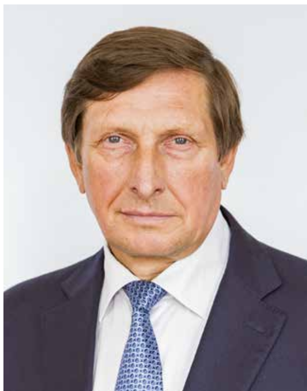
Николай Козловский, глава города Великие Луки