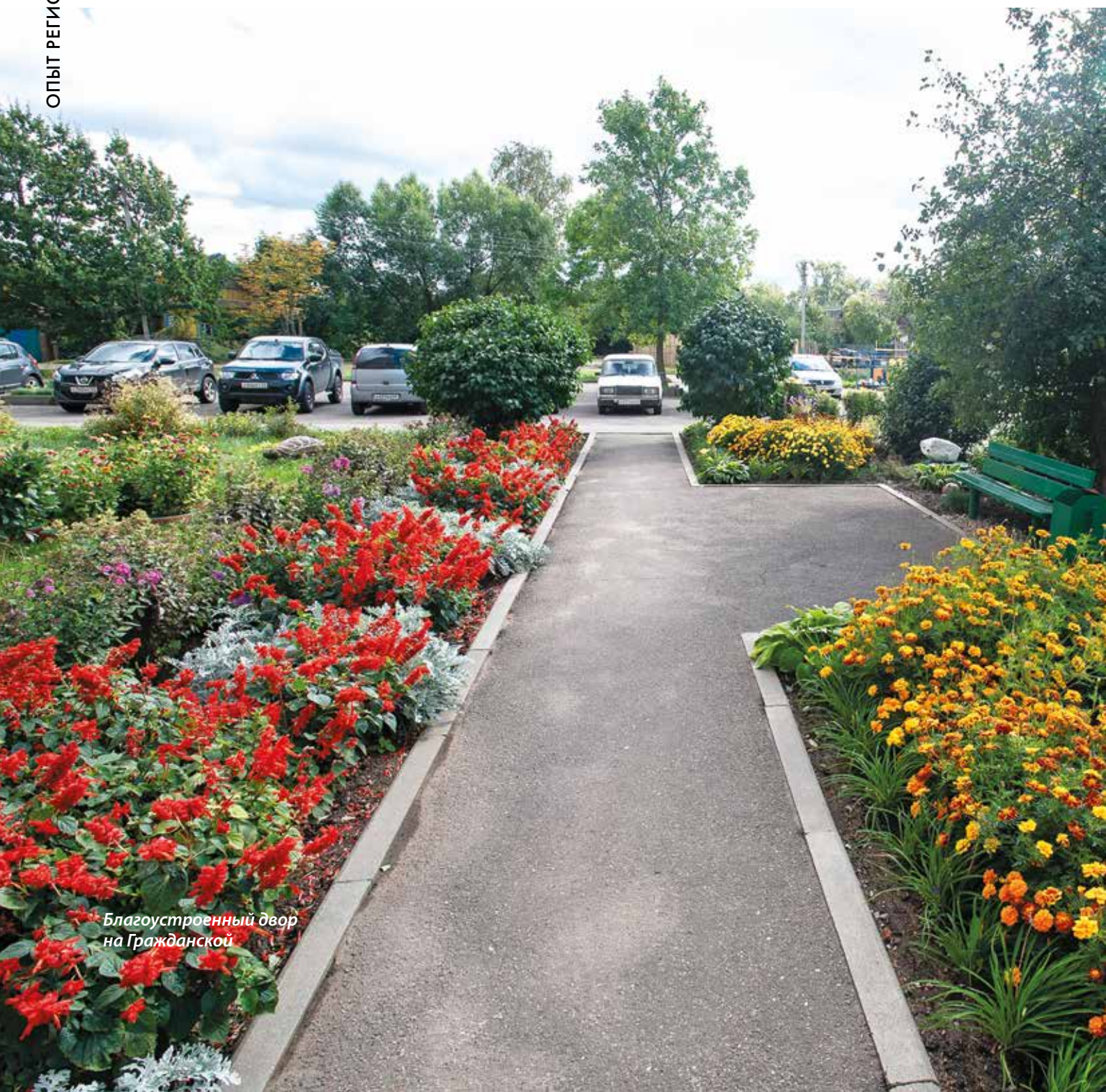
Благоустроенный двор на Гражданской

Для жителей каждый раз готовят интерактивную, развлекательную программу, в которой