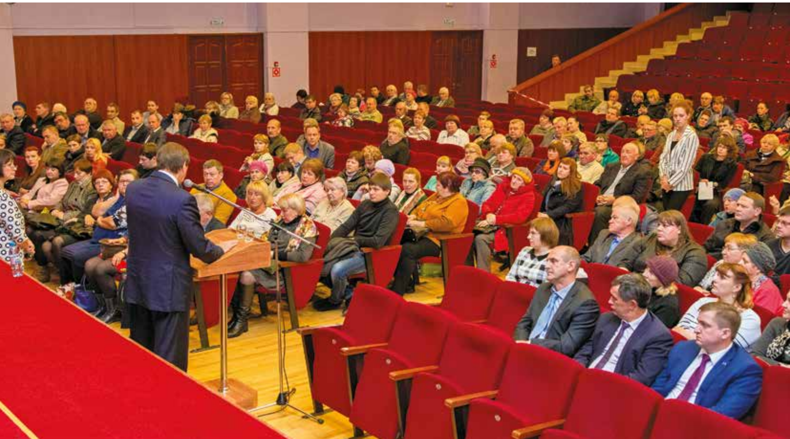
Встреча общественных советников

В 2020 году эта цифра уже была равна 249, и рост продолжается с каждым годом: в 2021 году количество проведенных субботников вновь выросло – уже до 253, а количество общественных советников главы города Великие Луки, принявших участие в мероприятиях по благоустройству, превысило 170 человек. Данная тенденция