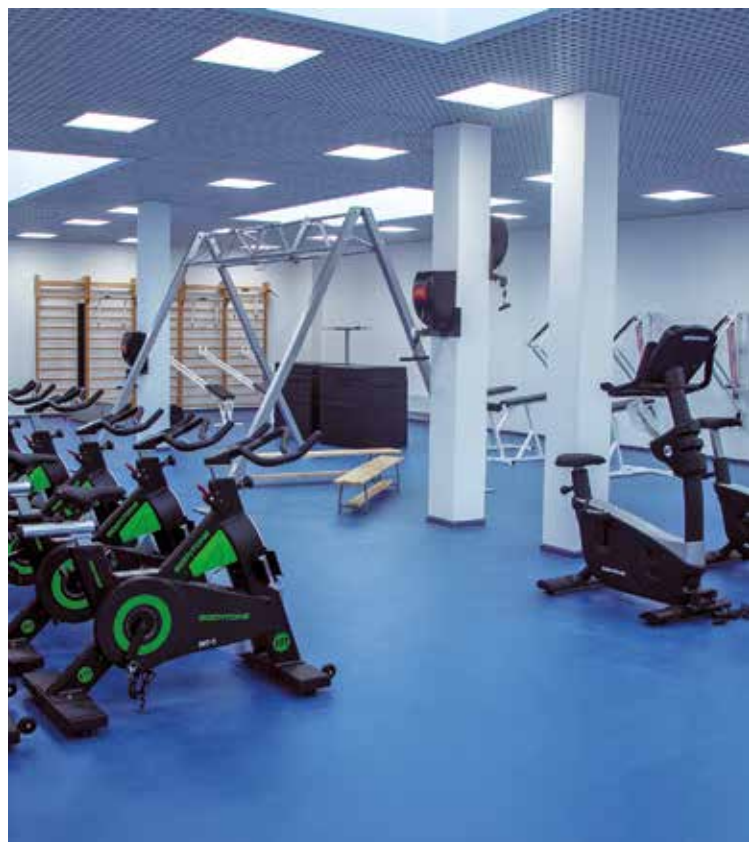
Спортивный комплекс «Айсберг»

Для повышения финансовой грамотности общественных советников было решено проводить